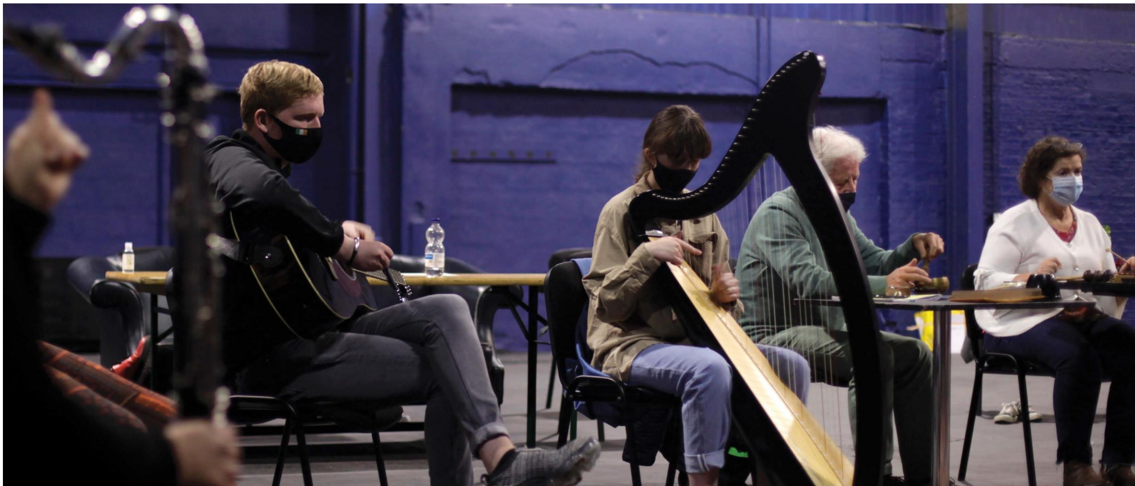
Taller a Dublín amb adolescents de la Irlanda rural i adults de Tallaght